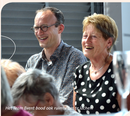
Het Team Event bood ook ruimte om te lachen.