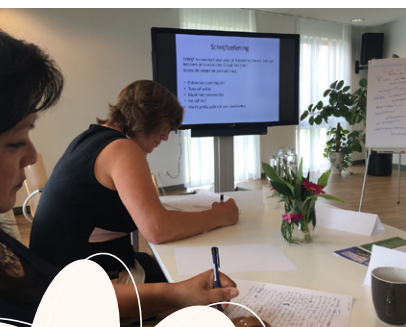
Tijdens de training werd er ook druk geoefend met schrijven.

Na afloop liet een deelnemer weten dat dat de training haar had geholpen om voortaan met meer vertrouwen te schrijven. Een ander gaf aan dat precies die tips werden aangereikt om een tekst prikkelend en uitnodigend te maken. Naderhand nam zelfs de dochter van een cursist contact op met de Schrijvende Zusjes. Zij stond te trappelen om de training ook zelf te mogen volgen. Een geslaagde training dus wat ons betreft! 📌