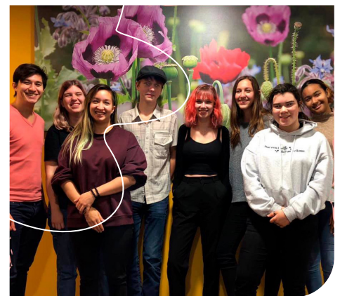
De organisatie achter GIG 2019 op bezoek in het hospice.

Verder leidde een teamlid van Bardo een singer/songwriter workshop in met het thema ‘verbondenheid’. Een thema dat zelfs als de