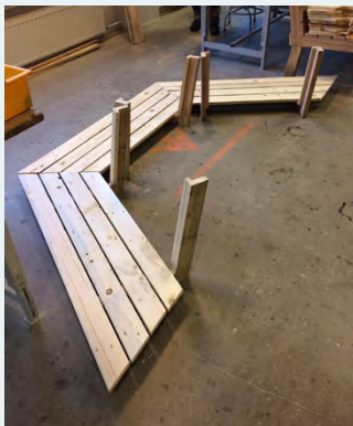
The making of .....