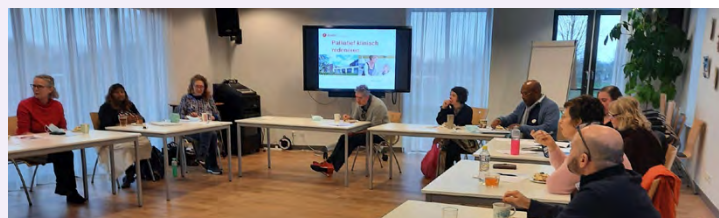
Het verpleegkundig team met elkaar aan tafel om de drie O's van klinisch redeneren te bespreken: Observatie, Onderzoek en Overleg.